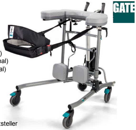
Abb. mit optionalen Zubehör