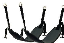
Sitz / Beingurte