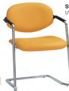
Stuhl ALEXA UVP je Stuhl 297,00 €