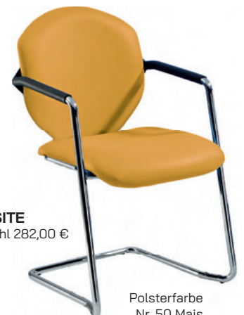
Stuhl VISITE UVP je Stuhl 282,00 €

Bitte bei Bestellung die Farbe angeben lt. Farbkarte (siehe oben).