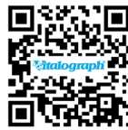
QR-Code zum Pneumotrac Video

Vitalograph A Global Leader in Respiratory Diagnostics